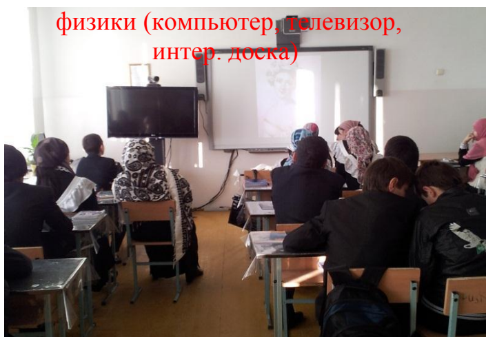
физики (компьютер, телевизор, интер. доска)