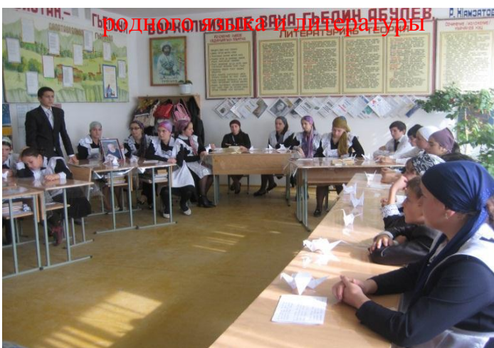
родного языка и литературы