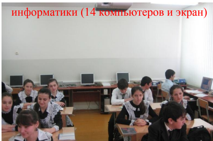
информатики (14 компьютеров и экран)