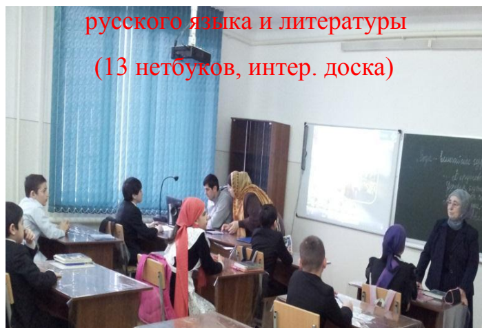
русского языка и литературы (13 нетбуков, интер. доска)